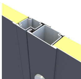
Przekrój: drzwi dwuskrzydłowa