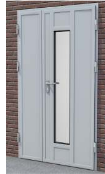
Drzwi dwuskrzydłowe z przeszkleniem na profilu „S”