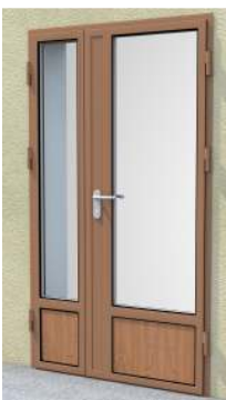
Drzwi dwuskrzydłowe z przeszklaniem 3/4 (panel drewniany 32 mm z uszczelką) na profilu „S”