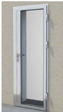
Drzwi z przeszklaniem maksymalnym na profilu „S”