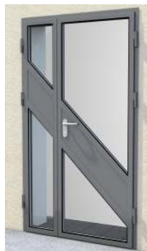
Drzwi dwuskrzydłowe z przeszklaniem na profilu „S”