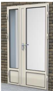
Drzwi dwuskrzydłowe z przeszklaniem 3/4 (panel 32 mm z uszczelką) na profilu „S”