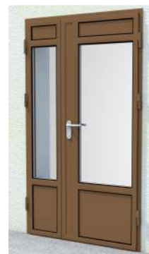
Drzwi dwuskrzydłowe z przeszklaniem (panel 32 mm z uszczelką) na profilu „S”