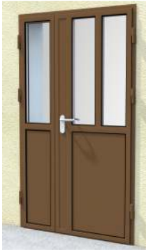
Drzwi dwuskrzydłowe z przeszkleniem 3/6 na profilu „S”