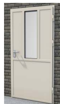
Drzwi z przeszklaniem 1/6 na profilu „S”