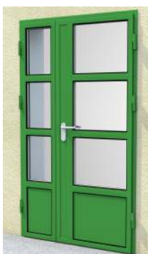
Drzwi dwuskrzydłowe z przeszkleniem na profilu „S”