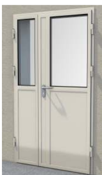
Drzwi dwuskrzydłowe z przeszklaniem (panel 42 mm – bez uszczelki) na profilu „S”