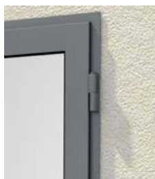
Widok: zawias systemowy