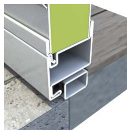
Przekrój: drzwi progowe