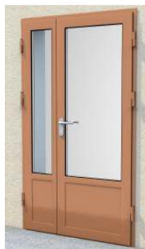
Drzwi dwuskrzydłowe z przeszklaniem 2/3 na profilu „M”