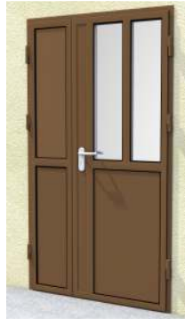
Drzwi dwuskrzydłowe z przeszkleniem 2/6 na profilu „S”