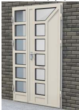
Drzwi dwuskrzydłowe z przeszkleniem na profilu „S”