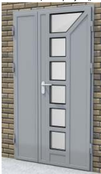
Drzwi dwuskrzydłowe z przeszkleniem na profilu „S”