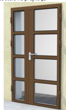
Drzwi dwuskrzydłowe z przeszkleniem na profilu „S”