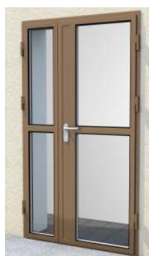
Drzwi dwuskrzydłowe z przeszklaniem góra/dół na profilu „S”