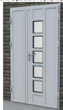
Drzwi dwuskrzydłowe z przeszkleniem na profilu „S”