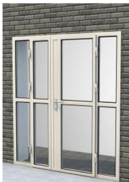
Drzwi dwuskrzydłowe z przeszkleniem na całości + prawa i lewa część stała na profilu „S”