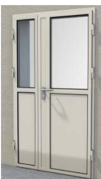
Drzwi dwuskrzydłowe z przeszklaniem (panel 32 mm z uszczelką) na profilu „S”