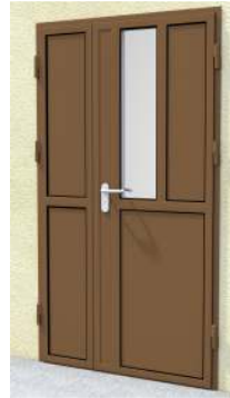
Drzwi dwuskrzydłowe z przeszkleniem 1/6 na profilu „S”