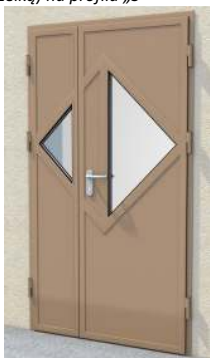
Drzwi dwuskrzydłowe z przeszklaniem trójkątnym na Profilu „S”