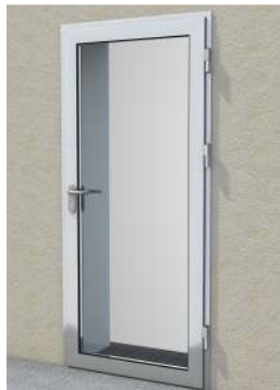
Drzwi z przeszklaniem maksymalnym na profilu „M”