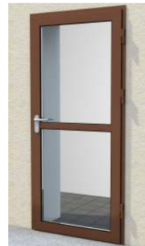
Drzwi z przeszklaniem maksymalnym na profilu „M” z poprzeczką