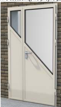
Drzwi dwuskrzydłowe z przeszklaniem na profilu „S”