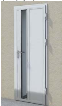
Drzwi z przeszklaniem częściowym na profilu „S”